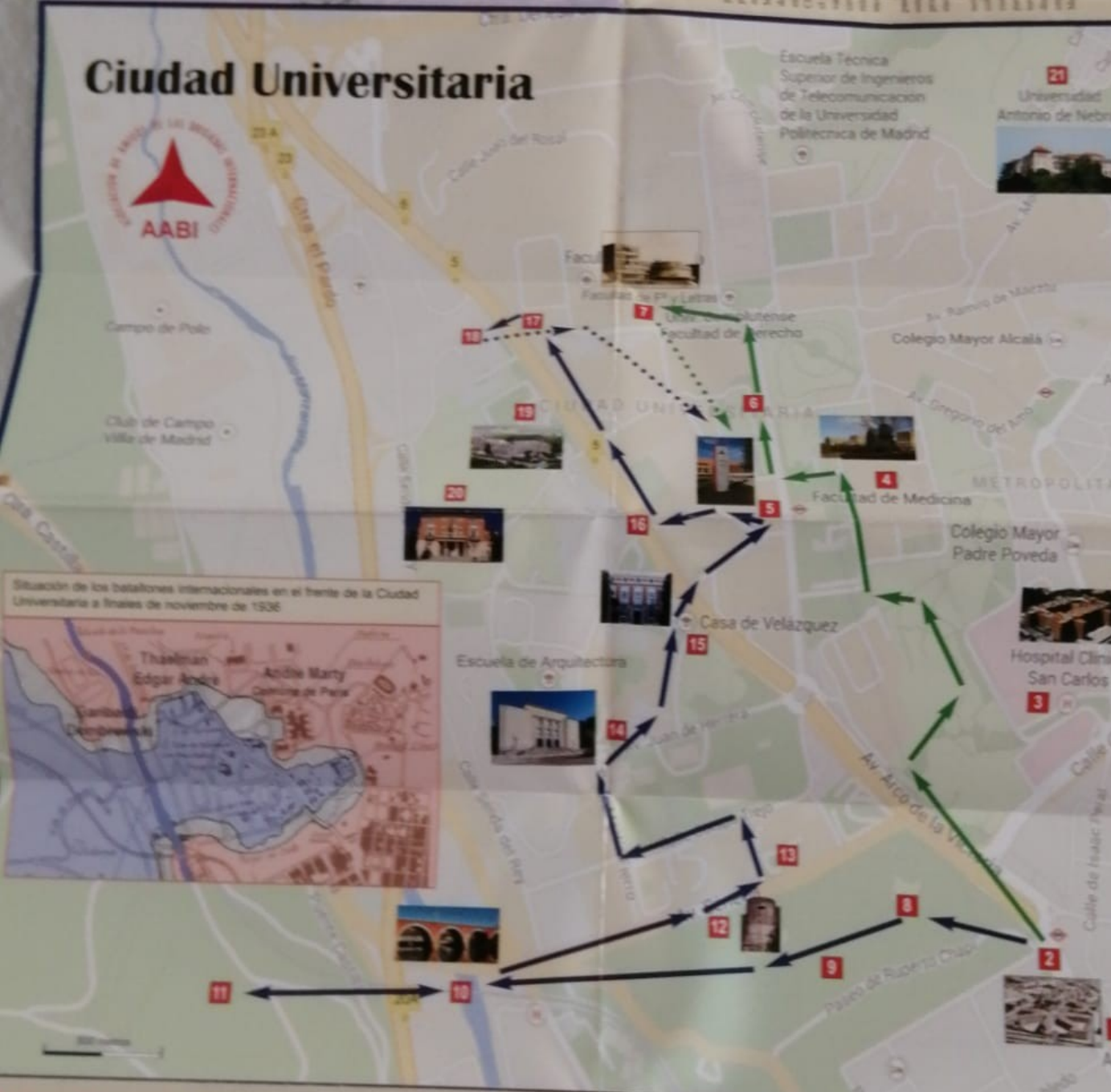
Mapa 2 Lugares de las Brigadas Internacionales en la Ciudad Universitaria